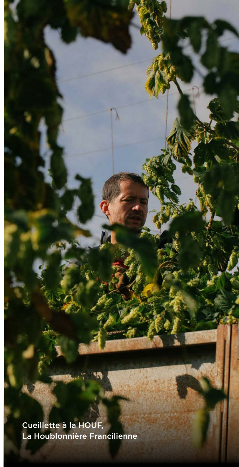
Cueillette à la HOUF, La Houblonnière Francilienne